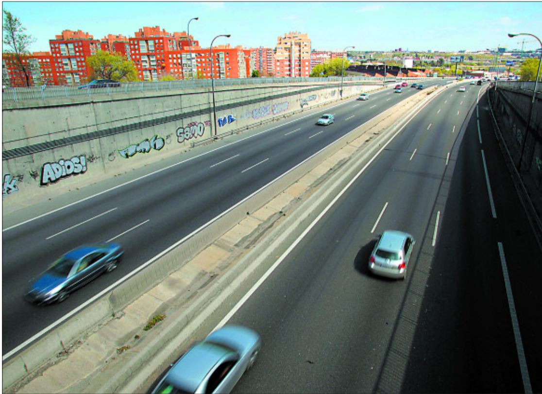
La autovía de circunvalación M-40, a su paso por Villaverde.

El impacto ambiental que tendrán las obras afecta al río Manzanares; el parque Lineal del Manzanares, el de Palomeras, en Vallecas; el del Espinillo, en Villaverde; el parque de Orcasitas; y el del monte de las Piqueñas, cerca al nudo de la Fortuna (Leganés). "El objeto del estudio